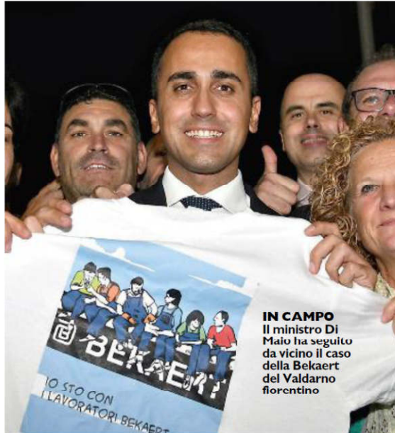
IN CAMPO Il ministro Di Maio ha seguito da vicino il caso della Bekaert del Valdarno fiorentino

«Il Governo deve andare avanti per altri 4 anni. Marchiamo la Lega su una serie di temi su cui è indispensabile porre un argine, come sulle strambe teorie del Congresso di Verona sulle donne che dovrebbero stare a casa. Ma non ci siamo di certo fermati: in queste settimane abbiamo varato il Decreto Crescita, lo Sbloccacantieri, abbiamo fatto un passo importante in Senato per il taglio di 345 poltrone di parlamentari (risparmio di 500 milioni). Mi auguro si possano mettere da parte slogan che estremizzano gli animi. Andiamo